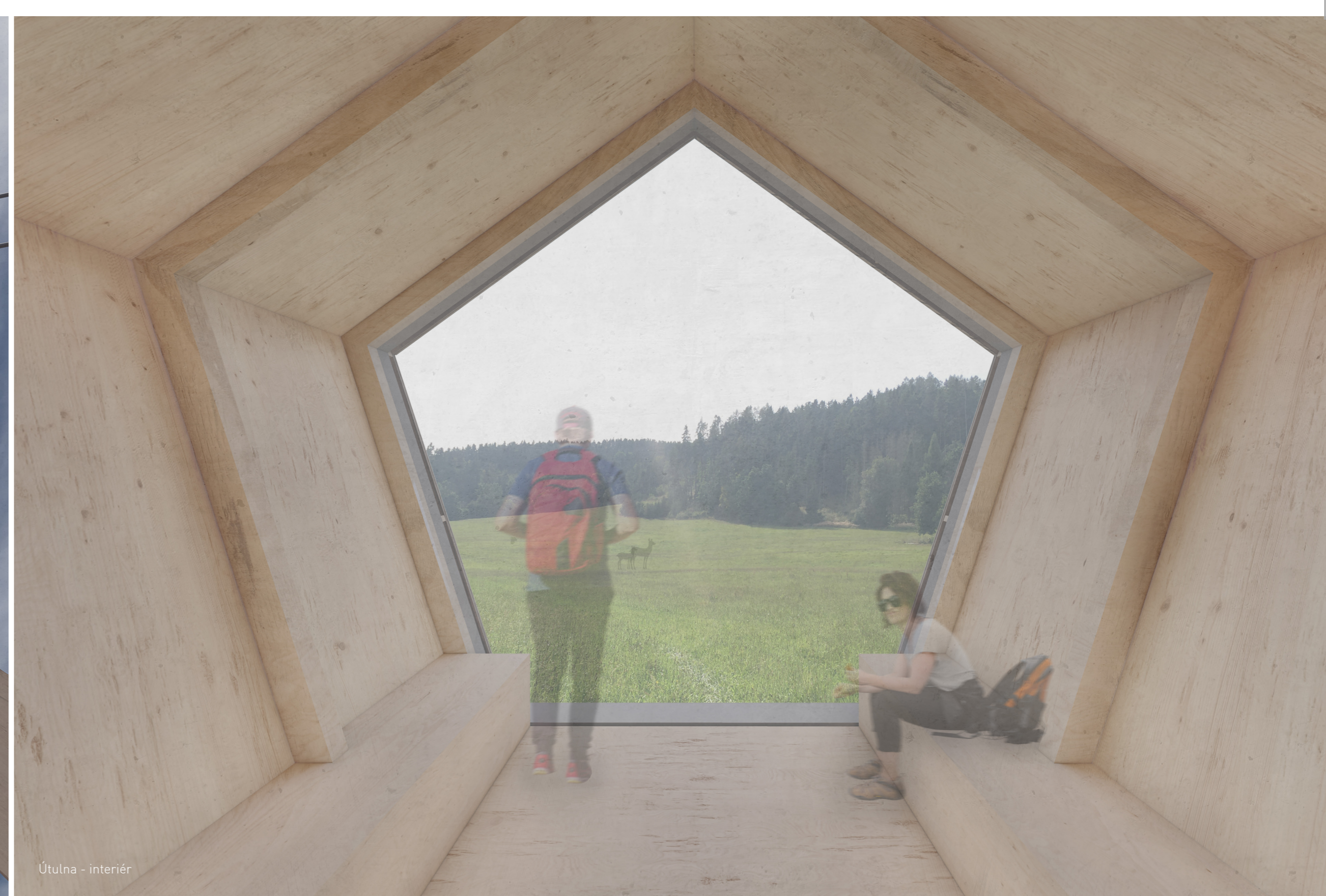
Útulna - interiér