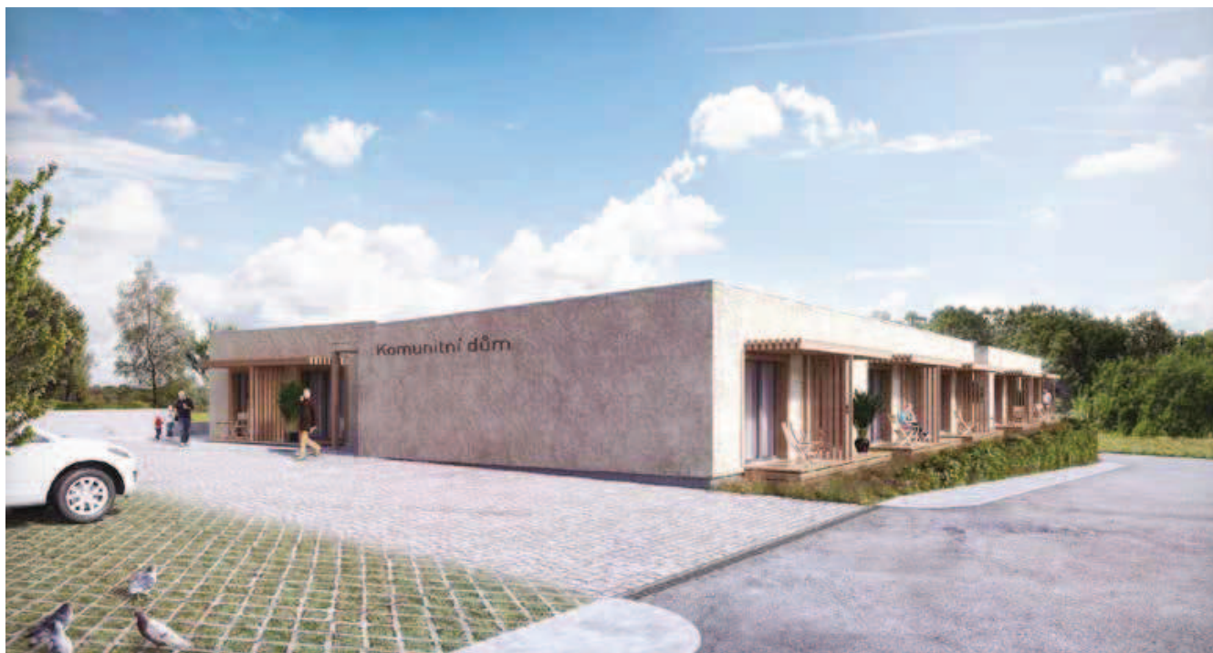
Vizualizace Komunitního domu v pasivním standardu pro bydlení seniorů

opatřená povrchovou úpravou. Z vnější strany je rošt opláštěn dřevovláknitou deskou. Finální povrch je tvořen difuzně otevřenou omítkou v kombinaci s větranou fasádou s dřevěným obkladem z modřínu. Hlavní tepelná izolace je foukané dřevovlákně tl. 320 mm.