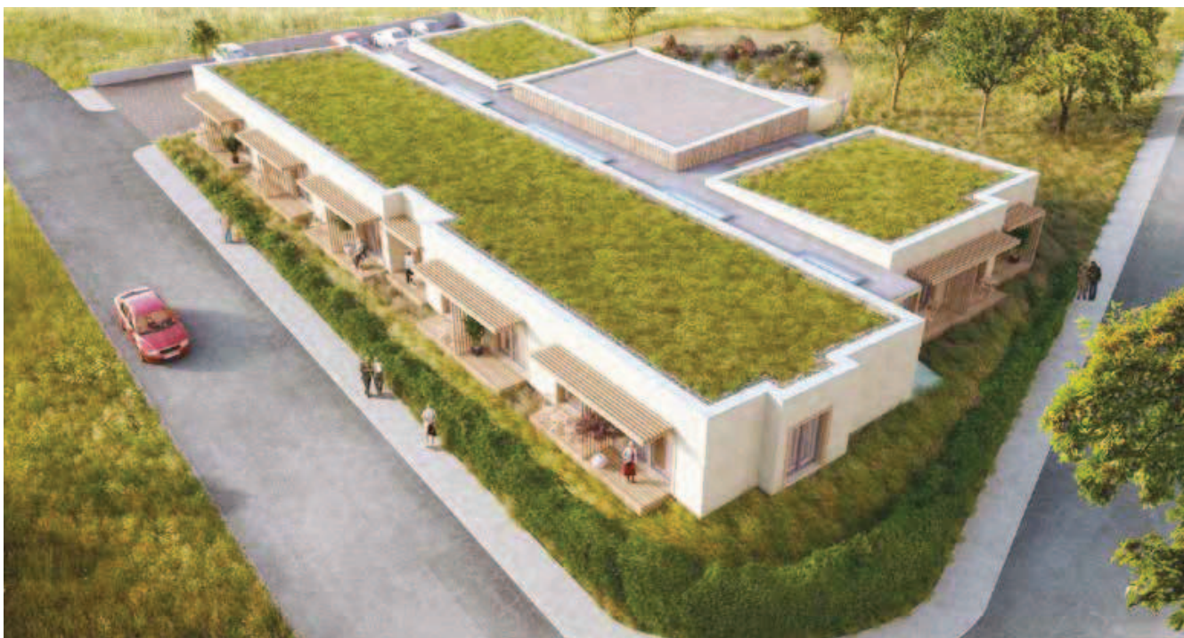
Vizualizace Komunitního domu v pasivním standardu pro bydlení seniorů

Řešené území se nachází na okraji obce a bezprostředně navazuje na oblast slepého ramene řeky Labe a plánovaného lesoparku. Celková koncepce lokality, souboru budov a zahrady je vedena snahou o jednoduché, funkční a kultivované řešení respektující krajinný ráz a historický kontext místa. Velký důraz je kladen na komfort a kvalitu vnitřního prostředí, trvalou udržitelnost, nízkou energetickou náročnost, ohleduplnost k životnímu prostředí, sociálně-ekonomické aspekty a osvětu. Lokalita bude řešena komplexně i z hlediska energetiky s důrazem na využití obnovitelných zdrojů energie.