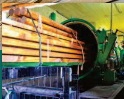
Impregnace dřeva proti biotickým škůdcům