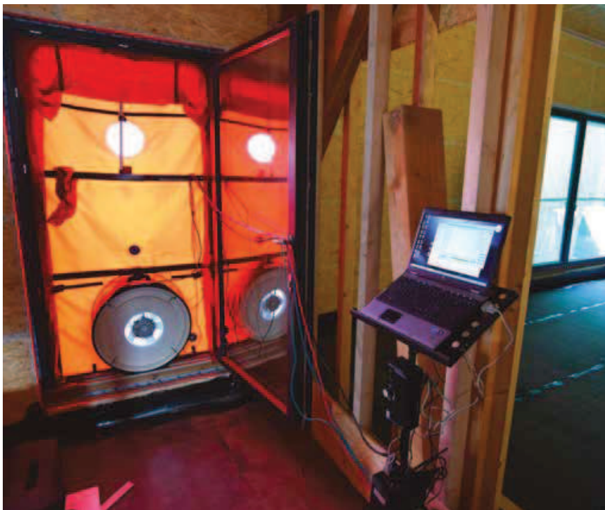
Zařízení Blower-door pro měření průvzdušnosti

Měřit by se mělo v nedokončeném stavu budovy s přístupem k hlavní vzduchotěsnicí vrstvě a detailům navazujících konstrukcí a prostupů. U dřevostaveb obecně je to nezakrytá parozábrana nebo vzduchotěsnicí vrstva – parobrzdka, kde jsou pro bezvadnou funkci důležitá jednotlivá napojení fólií nebo zajištění spár mezi konstrukčními deskami. Zkouškou se prověřují také přípojovací spáry otvorových výplní – oken, dveří, poklopů, světlovodů apod. Detekce defektů se provádí za konstantního podtlaku a přetlaku cca 50 Pa.