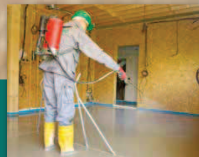
Jak na litou podlahu v dřevostavbě