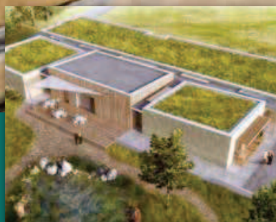
Měření průvzdušnosti pasivní dřevostavby domu pro seniory