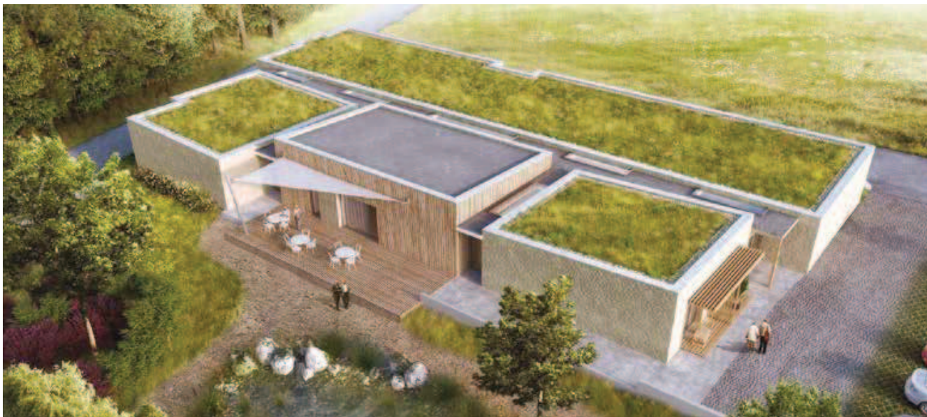
Vizualizace Komunitního domu v pasivním standardu pro bydlení seniorů