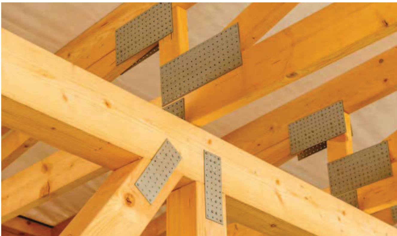
Detail spojů nosné konstrukce vybraných domů Atria