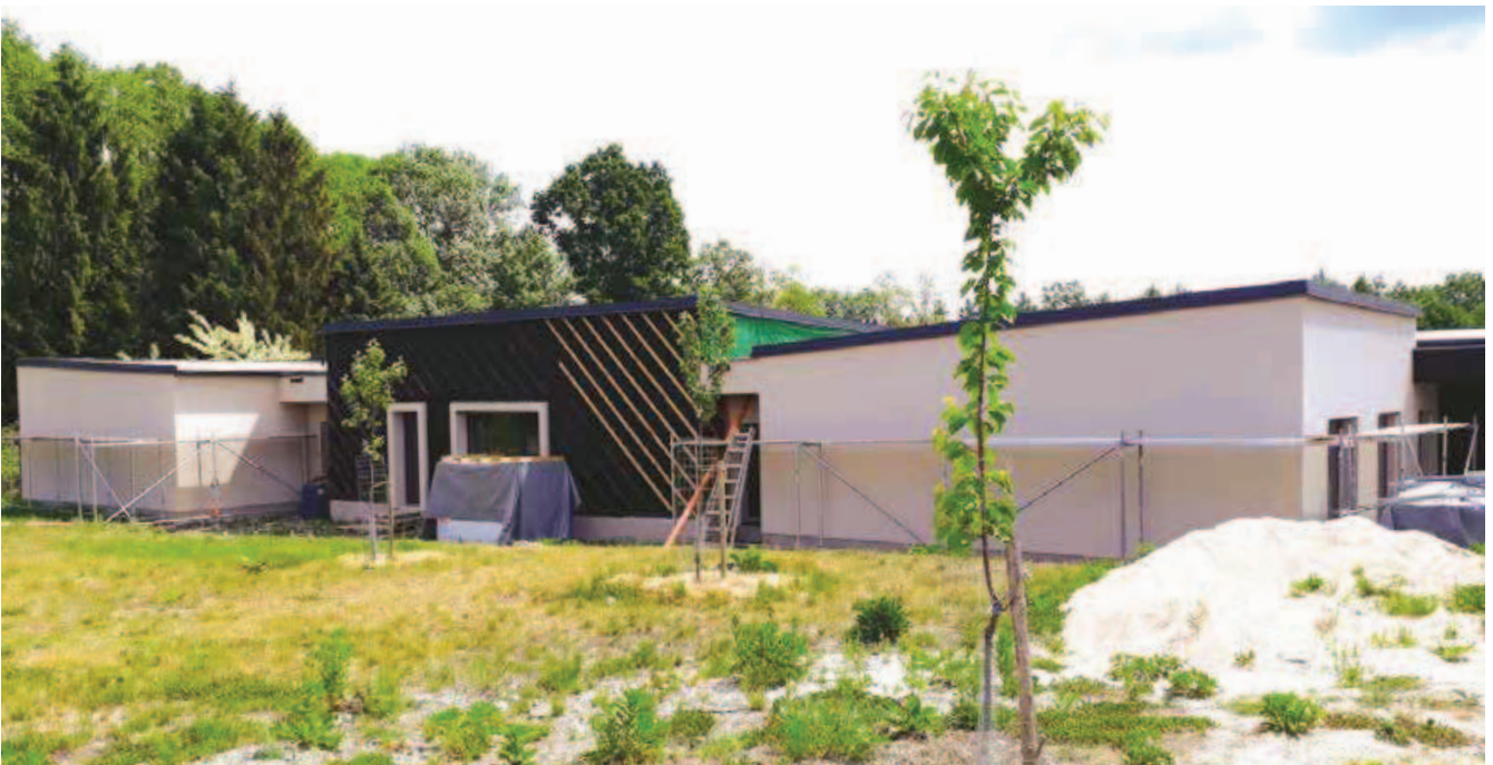
Současný stav výstavby Komunitního domu

„Investor se až po zahájení stavby rozhodl využít dotačního programu Nová zelená úsporám. Objekt je tedy v současné době optimalizován tak, aby splnil parametry a podmínky dotačního programu, tzn. má měrnou potřebu tepla na vytápění