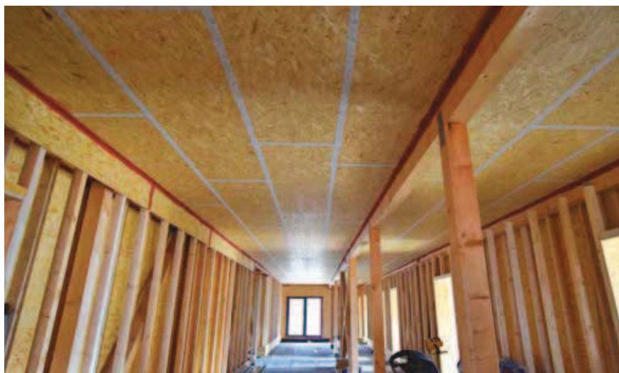
Parobrzda z OSB desky 3 15N-4PD lepené ve spárách s přepáskováním