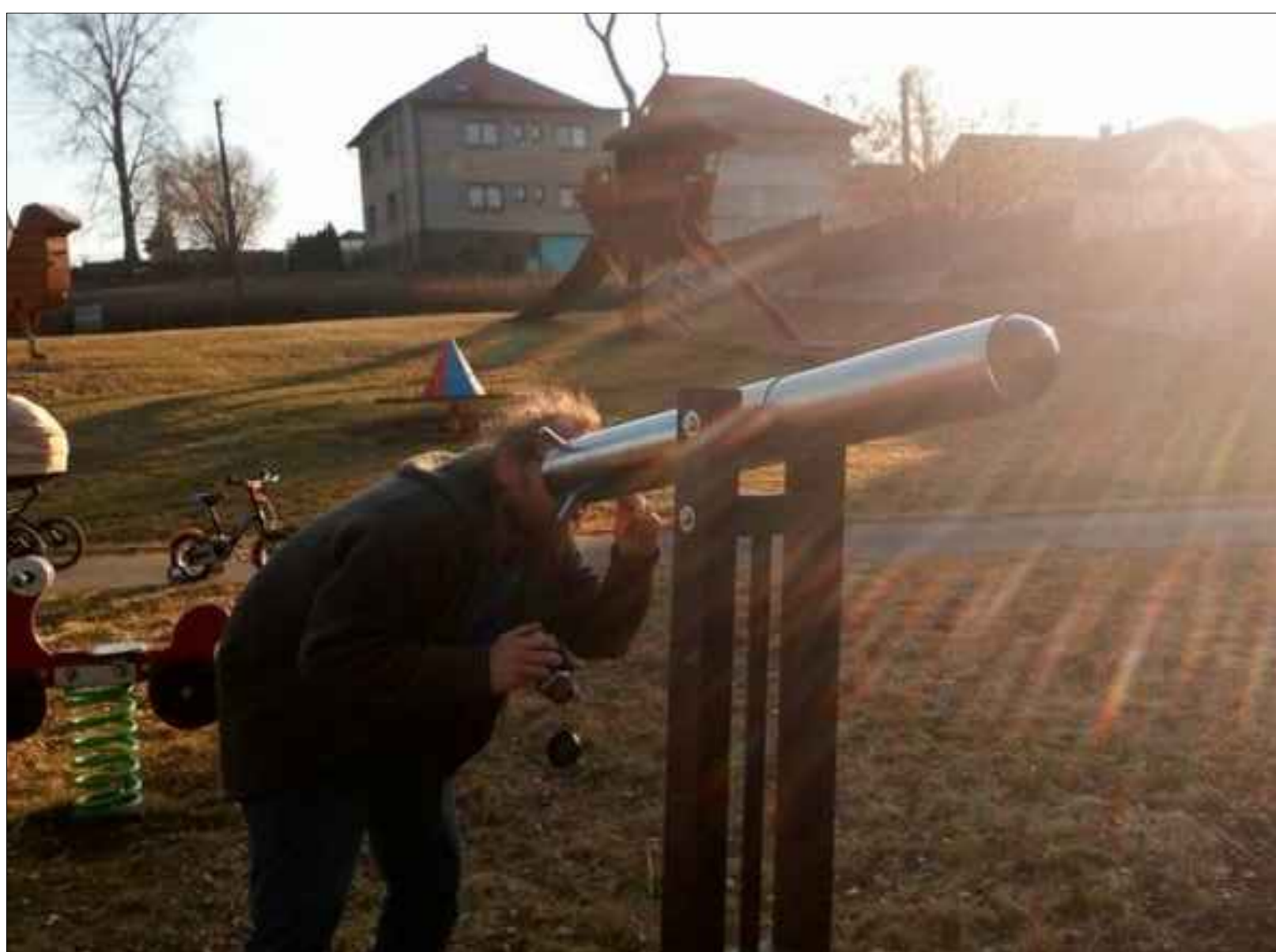
VENKOVNÍ KRASOHLLED - na samostatném stojanu umožní pohyb v obou osách, bude se jednat o zv. teleidoskop - tedy krasohled, který opticky tříští reálný obraz, v tomto případě lesa. Nerezové provedení. viz např. http://www.krasohledy.cz/eshop.asp?sm=17&pid=78