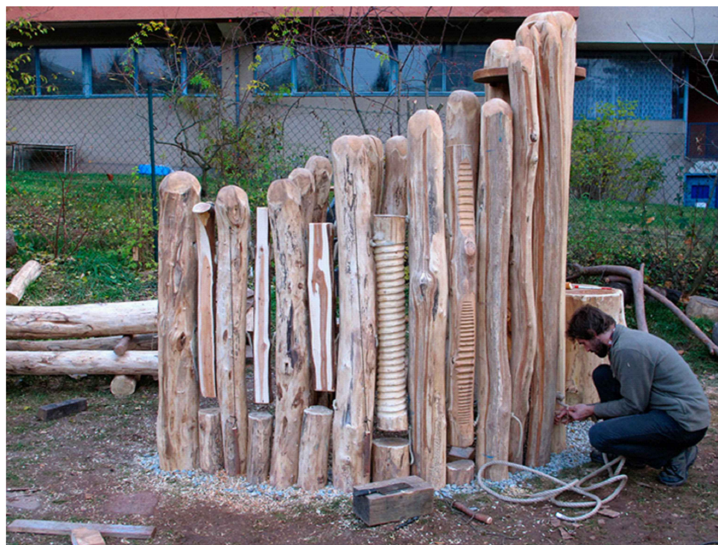
DRHADLA - akátové kmeny s různým reliéfním zpracováním, kotvení na štěrkový základ, anebo do betonu, min. 5ks, různé struktury, různé výšky, vždy min. 130cm nad zem. Doplněny budou drhacími paličkami zavěšenými na řetízku či nerez lanku.