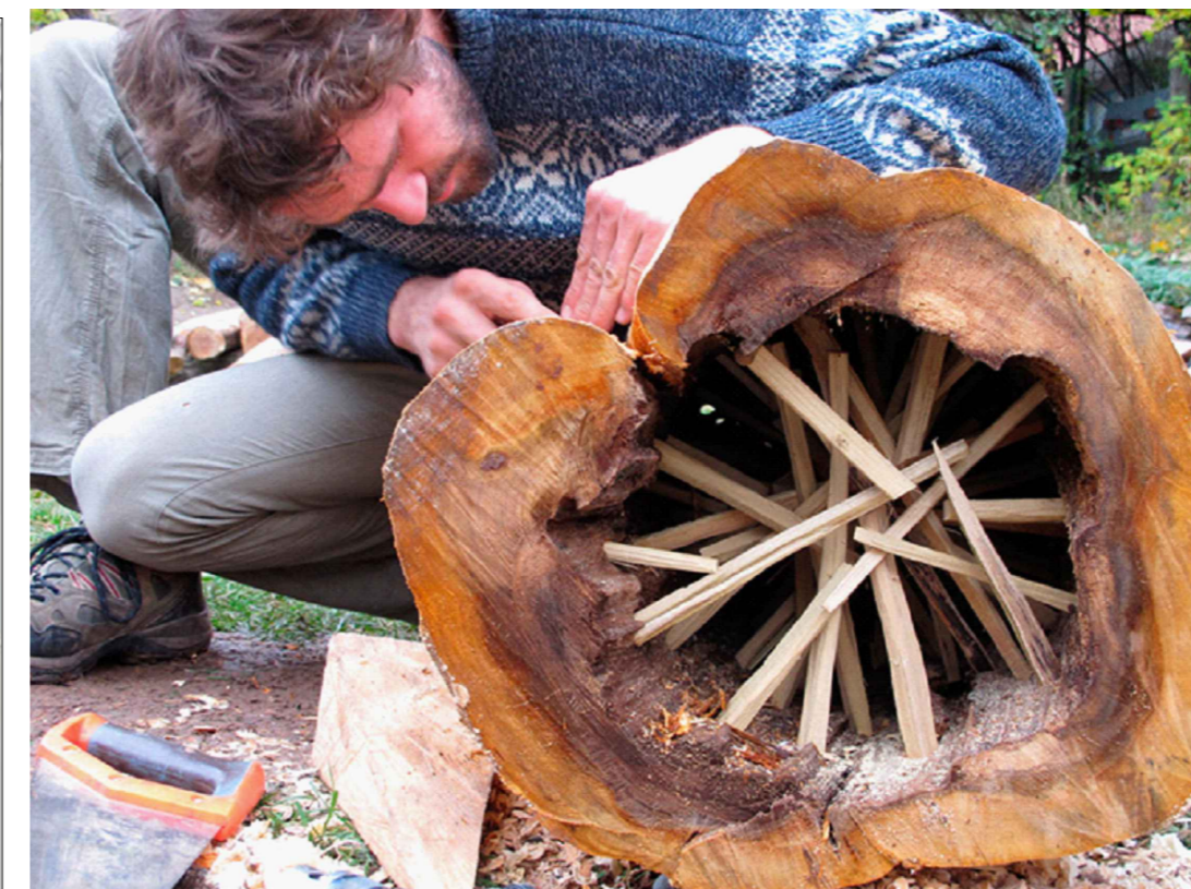
DEŠŤOVÁ HŮL NEBO TRUBKOVÝ ZVON - bude se jednat o velký akustický prvek - dešťová hůl - dutý kmen plný dřevěných kolíků - shora otvor pro vhození kamínku - padající kamínky rozezvučí kolíky. - trubkový zvon - v dutém prořízlém kmeni je zavěšen trubkový zvon - viz. např. https://www.lecive-zvonkohry.cz/cenik/

bude instalován jen jeden z těchto prvků. V případě instalace dešťové hole bude její okolí vysypáno kačírkem či štěrkem