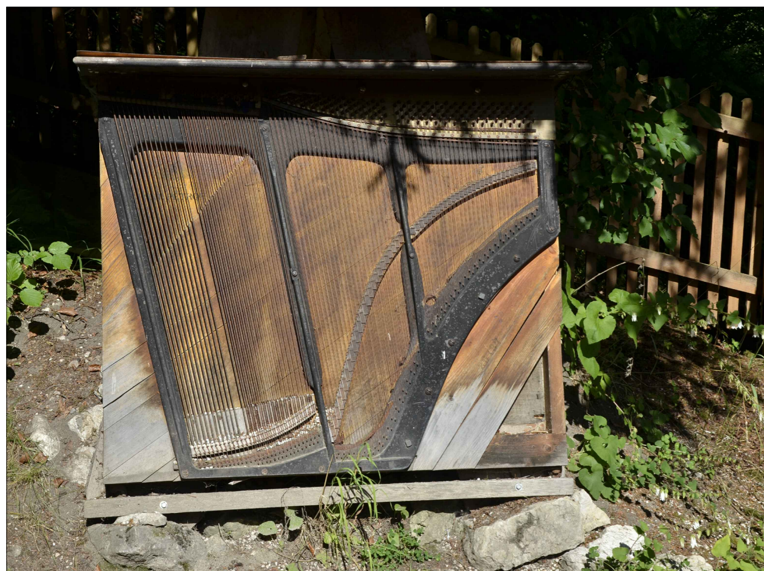
KOVOVÝ RÁM Z PIANINA / PIÁNA - z vyřazeného klavíru bude využit kovový rám se strunami, bude kotven na nosnou překližkovou desku v rámu Interaktivního panelu